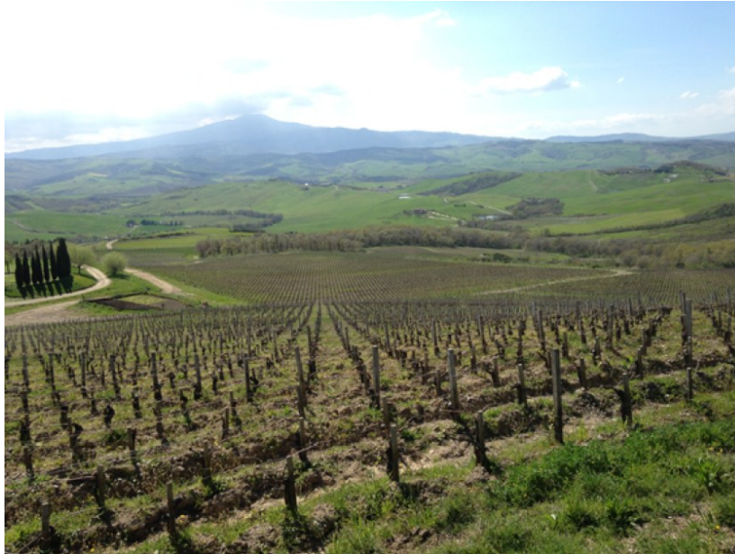
Tenuta di Trinoro